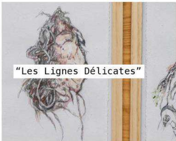
"Les Lignes Délicates"

du 24 mars au 15 avril vernissage vendredi 8 avril 18h